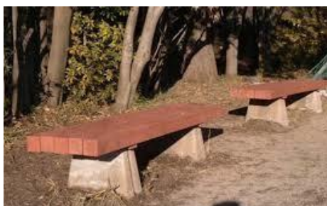
■簡単に作れそうだなあ