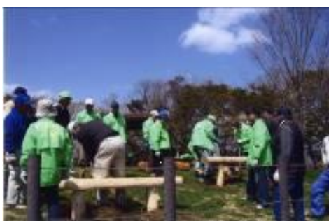
■皆でベンチを作ろう(羽根尾公園)

みどり公園課では、「簡単なベンチづくり」の支援を進めております。材料の手配、作り方など、相談しながら取り組んでみませんか。