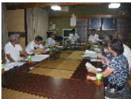
■プロデュース会議（成田公園）

みどり公園課は、会議に参加させていただき、必要な資料の提供や先進事例の紹介などをさせていただきます。