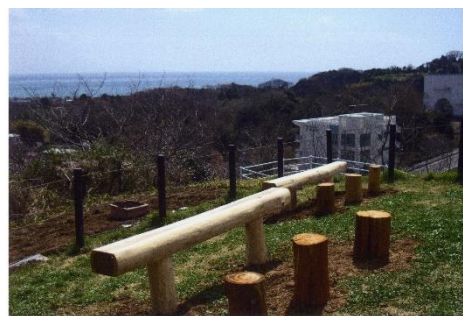
■ベンチ完成(羽根尾公園)