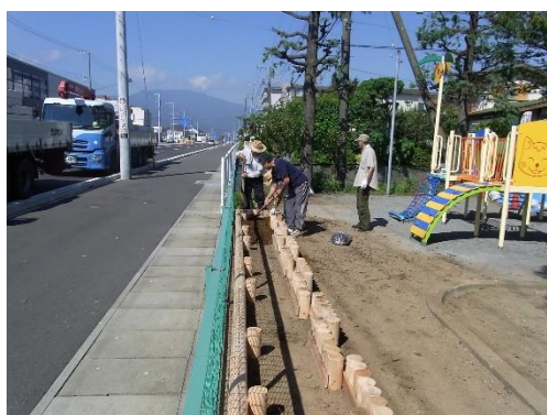
■手作り花壇製作中(成田公園)

公園は、地域共有の「庭」とも「社交場」とも言われます。花壇を設置したり、増やしたりすることで、その公園が華やかに明るくなり、また、花壇の除草や植替え等を地域の方々が寄り添い、語り合いながら作業を行う事で、公園に愛着が生まれ、新たなコミュニティづくりなどの効果も期待されます。