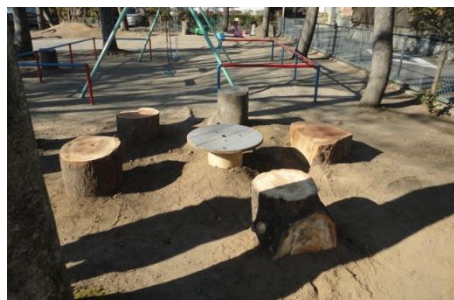
■材料も現場で調達しました