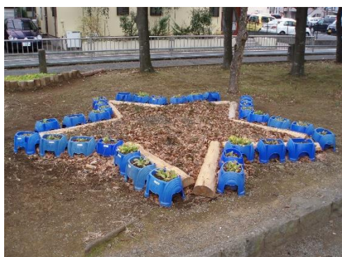
■こんな形の花壇もカワイイですね