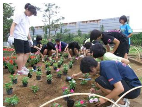
■花植え作業中(酒匂浜公園)