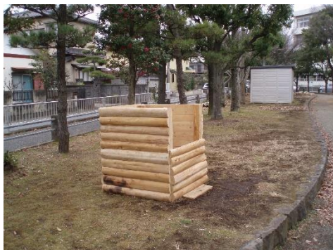
■たい肥置き場(南鴨宮富士見公園)

こうすると、「落ち葉の処理が楽になる」、「ゴミの減量になる」などの効果があります。